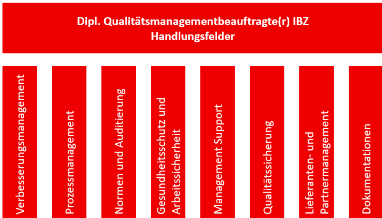
Abbildung 1 Handlungsfelder Lehrgang Qualitätsmanagementbeauftragter

Für die Funktion des Qualitätsmanagementbeauftragten haben wir die nachfolgenden Handlungsfelder definiert.